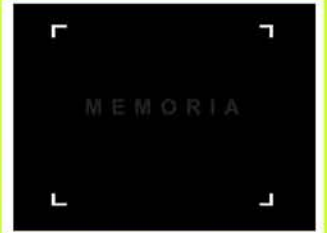
Horst Hoheisel Taller/ Workshop