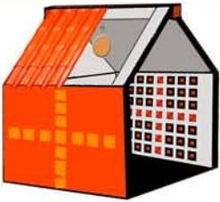
Nayari Castillo Santuario a las ánimas de la 8va Isla