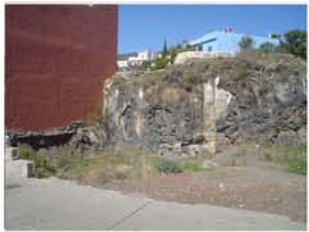
Rodrigo Yanes Identidad Ausente