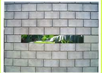
Néstor Torrens El hueco